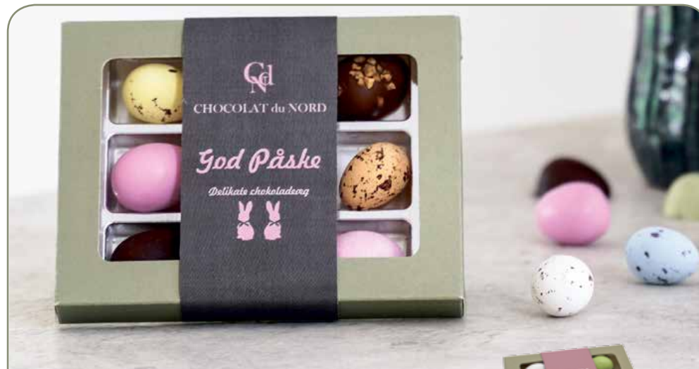
22. FUNC • grøn æske • kr 52,- God påskeæske grøn, marcipan/pastel/fugleæg 9 stk. 105-115 g (mulighed for logobånd/påskehilsen + kr 8,00 ved 100 stk)