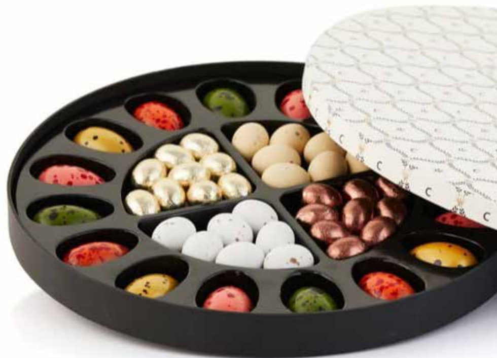
17. PR CHOKOLADE • stor rund æske • kr 271,- Et skønt mix af chokoladedrageæg, fyldte hjemmelavede chokoladeæg med forskellig smag samt multicolour pralinéæg med nougat fyld i rund hvid Cocoture Palæ æske. 600 g