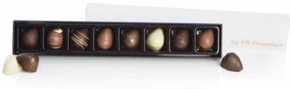
15. PR CHOKOLADE • 8 marcipanæg • kr 61,- 8 stk. assort. marcipanæg i sort aflang æske. 104 g