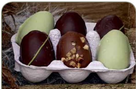
19. FUNC • æggebakke 6 æg • kr 35,- Æggebakke, marcipanæg 6 stk. 63-68 g