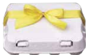
FUNC • æggebakke med logo Æggebakkerne leveres med gul sløjfe. Ellers mulighed for logo/påskehilsen + kr 8,00 ved 100 stk.