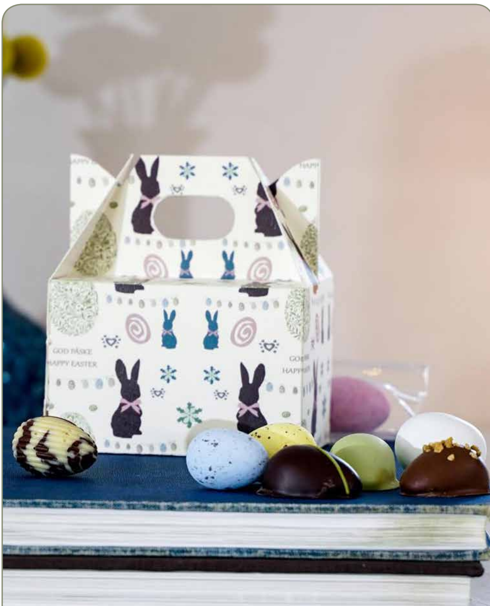
24. FUNC • påskebox • kr 45,- Påskebox Easter Bunny, påskemix flowpack 90-100 g