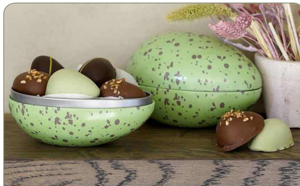
23. FUNC • metalæg • kr 75,- Tinæg grønt, store marcipanæg 6 stk. 190-200 g