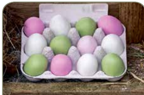
20. FUNC • æggebakke 12 æg • kr 55,- Æggebakke, marcipanæg pastel 12 stk. 175-185 g