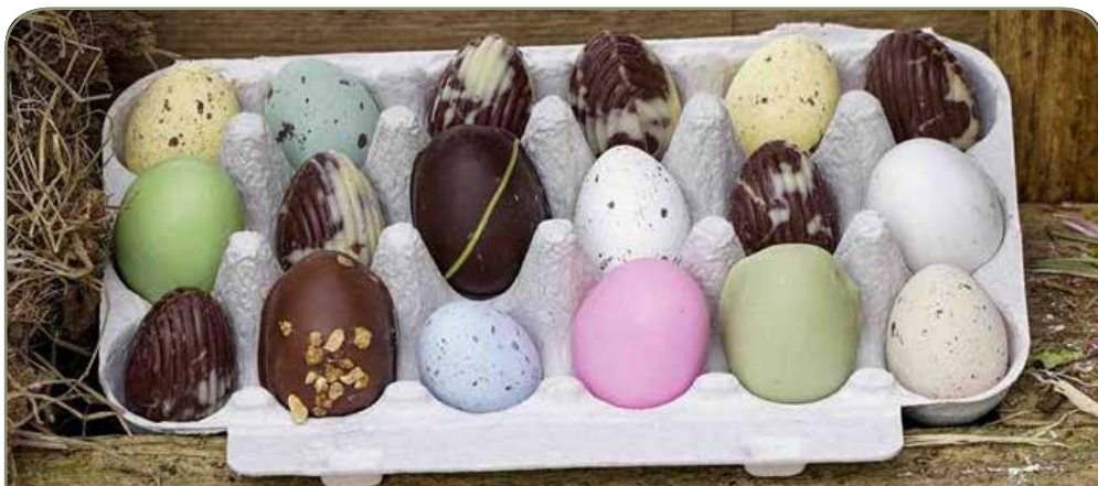
21. FUNC • æggebakke 18 æg • kr 75,- Æggebakke, påskemix 18 stk. 200-210 g