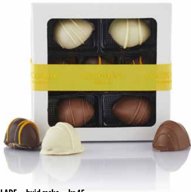
16. PR CHOKOLADE • hvid æske • kr 45,- 7 stk. assort. marcipanæg i hvid æske med gult Cocoture bånd. 91 g